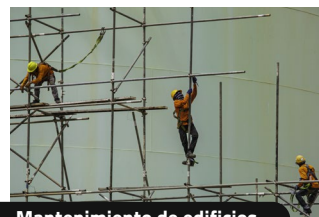
Mantenimiento de edificios.