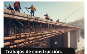
Trabajos de construcción.