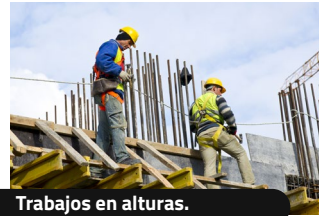
Trabajos en alturas.