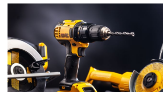
Manejo de herramientas.