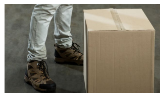
Levantamiento de objetos